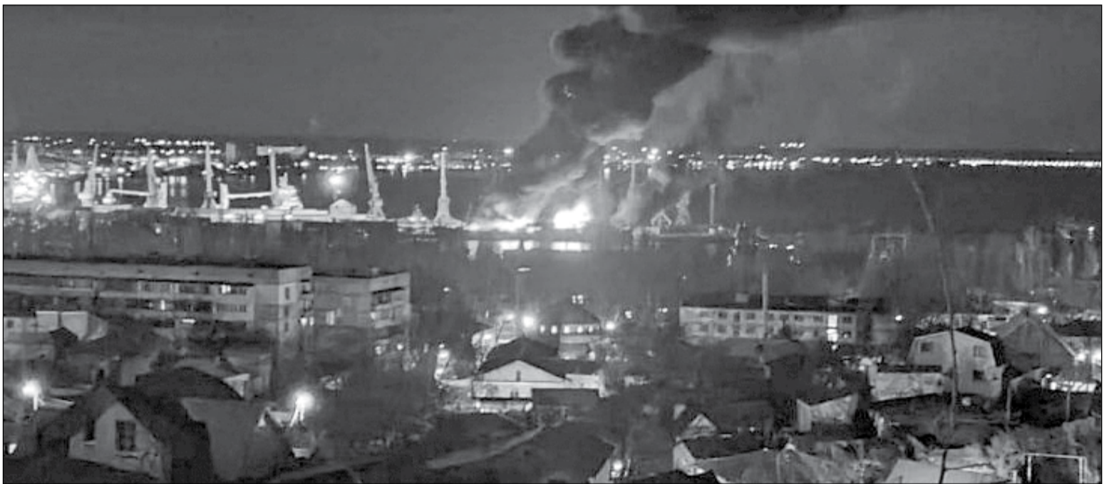
• Момент удару українськими ракетами по рашистському десантному кораблю «Новочеркаск» у Феодосії

«Варварська атака, дуже велика кількість загиблих і дуже важко встановити, скільки саме людей загинуло в той день», – сказав він. За попередньою інформацією, кількість жертв: 11 загиблих і 10 поранених. Однак остаточні цифри буде встановлено після відповідної експертизи. Міністр внутрішніх справ України Ігор Клименко повідомив, що загиблих шукали за допомогою собак, натренованих на пошук останків. Слідчі оглядають знайдені фрагменти тіл, криміналісти вилучають біологічні зразки та проводять ідентифікацію.