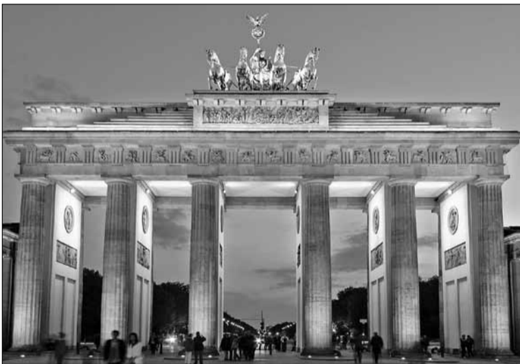
● Берлін. Бранденбурзькі ворота в стилі «еллінізму»