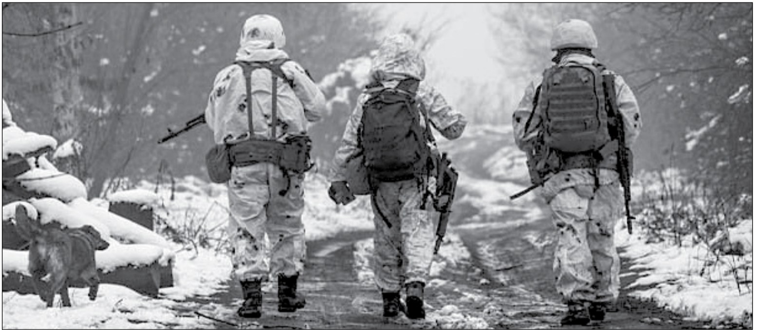
• Позиції українських оборонців під Авдіївою

А тим часом, у Покровському районі Донецької області завершили пошуково-рятувальні роботи після удару окупантів, що стався 6 січня. На місцях атаки знайшли понад 100 фрагментів людських тіл. Про це повідомив очільник обласної військової адміністрації Вадим Філашкін.