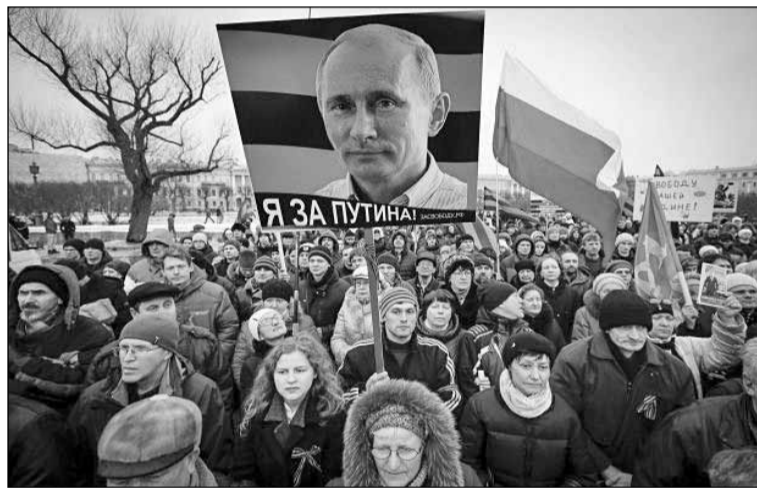
● Путін у своїй загарбницькій зовнішній політиці спирається на віддану йому тупу й безлику більшість російського народу

Отже, перемир'я, яке запропонував Путіним, геть не є його кроком у напрямку розбудови миру, як це може здаватися багатьом найвішим політикам Заходу. Це крок у напрямку продовження війни, але вже краще підготовленої, а відтак – ще більш масштабної й кривавої, ніж попередня. Будь-який мир з Путіним – це не що інше, як відкладена війна.