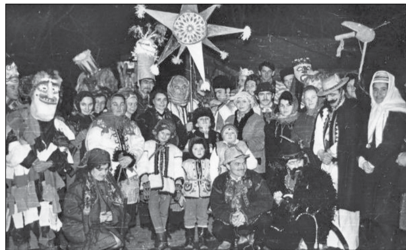
• Так виглядав різдвяний вертеп у Львові 1972 рік

За юліанським, старим стилем живуть: Російська, Грузинська, Єрусалимська, Сербська, Македонська, Чорногорська. Що цікаво: Польська Автокефальна Православна Церква, яка складається з українців і білорусів, жила за новоюліанським стилем з 1924 року, а кілька років тому повернулася на старий стиль. Подібне сталося і в Македонському Православ'ї. Дискусії про таке ж повернення нині йдуть у Болгарській, Румунській та Грецькій Церквах. У 1923 році під тиском більшовиків Патріарх Тихон видав указ про перехід Російської Православної Церкви на новоюліанум. Указ виконали тільки в Москві, а за три тижні внаслідок безлічі прохань з усієї Росії було вирішено «повсеместное и обязательное введение нового стиля в церковном употреблении временно отложить».