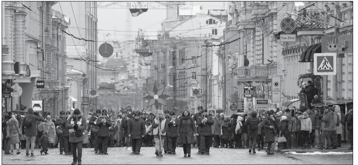
• Слобожанщина. Радість різдвяного єднання. Січень 2022 р.

дідух і прощалися з колядою. Кожна вулиця в селі мала свої гурти, які переважно колядували «на церкву». Після Йорданських свят вони йшли з колядою та дідухом. Кожен – зі свого «кутка». Сходились посеред села, чи на вигоні. Дідухи складали докупі, а після колядок їх запалювали. Цей обряд довіряли найстаршому, або ж найшановнішому колядниківі. Це називалося «паління різдвяного діда».