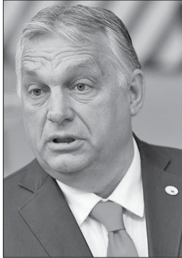
● Відданого друга Путіна Віктора Орбана, який у Європі «дістав» усіх, не допустять до посади Президента Європейської Ради

«Хочу, щоб усі розуміли: в будь-якому разі в червні мало бути ухвалено рішення про мого наступника, тож Європейській Раді буде легко зробити так, щоб мій наступник вступив