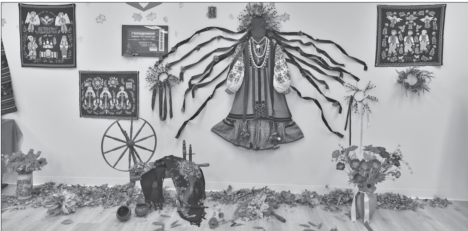
• Інсталяція «Невинно убієнні», приурочена вшануванню жертв українського Голодомору-ґеноциду 1932-1933-х років