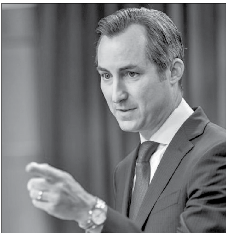
• Оголосити про різке зменшення в нинішньому році військової допомоги Україні з боку США доручили прес-секретареві Держдепартаменту Метью Міллеру

По-друге, за дивним збігом обставин, «план Байдена» має всі шанси вже ближчим часом перетворитися, якщо не на «план Путіна», то таки точно на «план двох президентів». Упро-