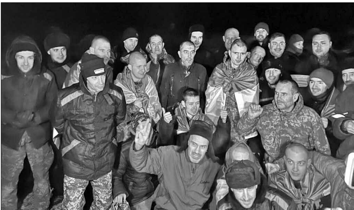
● Унаслідок обміну полоненими, здійсненого 4 січня, з путінських катівень до своїх рідних і близьких повернулося 230 українців і українок

Як зауважив Умеров, на повну зміг запровадити внутрішній аудит та оновлена Генеральна інспекція Міністерства оборони. Вони вже виявили багато порушень.