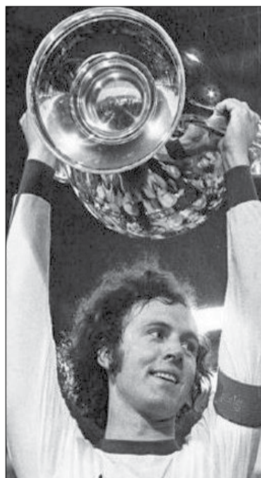
● Франц Бекенбауер залишиться в пам'яті мільйонів уболівальників футболу як один з найвидатніших гравців усіх часів і народів

Він зіграв 103 матчі за збірну Західної Німеччини й 582 – за мюнхенську «Баварію» і знову ж таки виграв золоті медалі у вищому дивізіоні Німеччини і як гравець, і як тренер. Як гравець «Баварії» він виграв чотири чемпіонські титули та був капітаном команди під час трьох виграшів