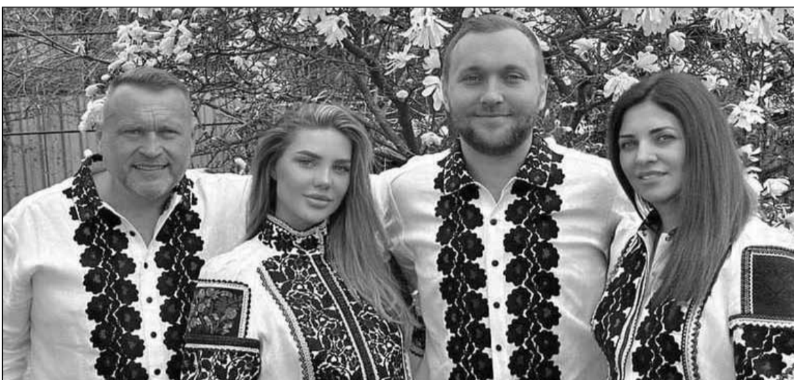
● Одіозна сім'я Гринкевичів зі Львова побудувала свій добробут і розкішне життя, розкрадаючи те, що належить захисникам України

«Тісно співпрацюємо з правоохоронцями та спеціальними службами, тому попереду будуть ще новини», – анонсував міністр.