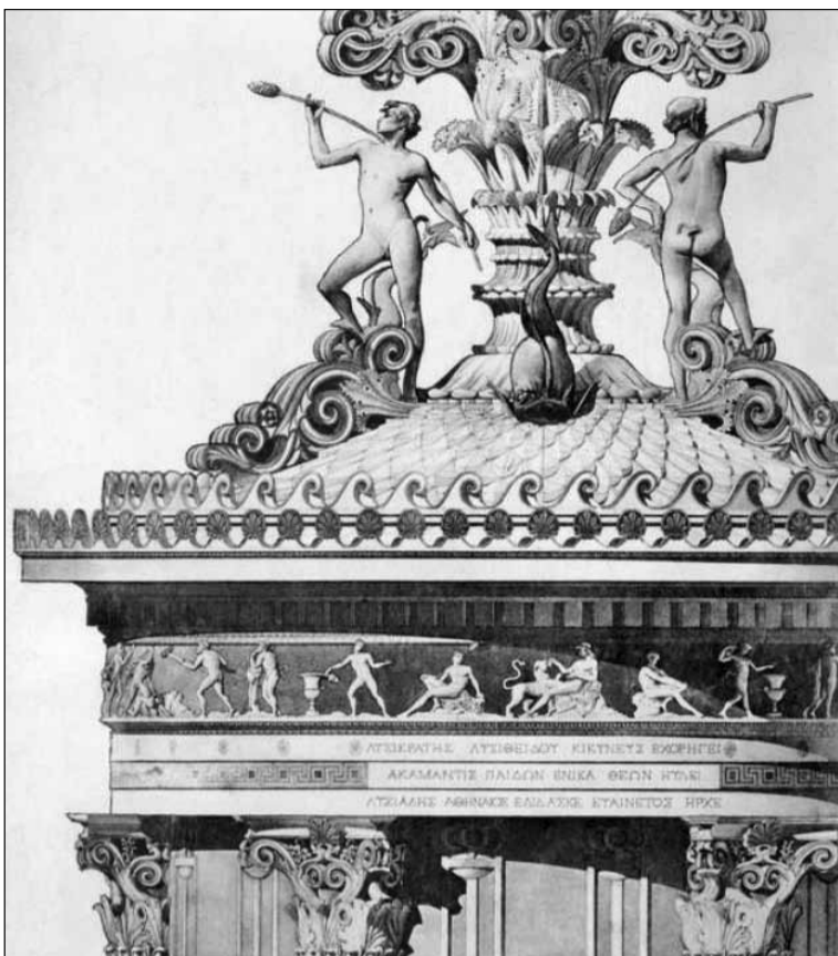
● «Ліхтар Діогена» – як ікона модного стилю неогрек