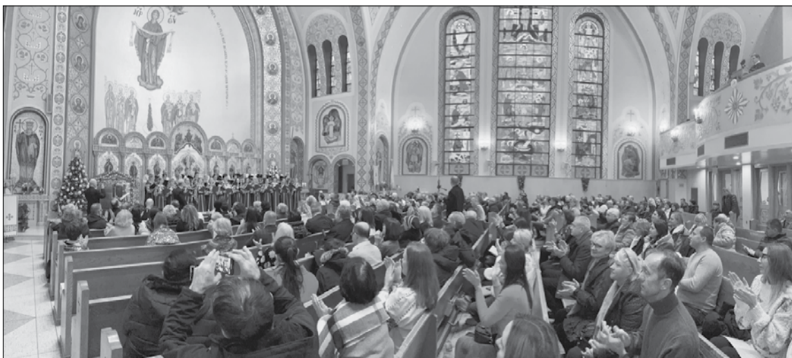
● Овації вдячності від слухачко-глядацької зали під склепінням церкви Святого Юра