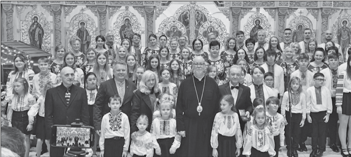
● Фото на згадку з поважними гостями, родиною та артистами