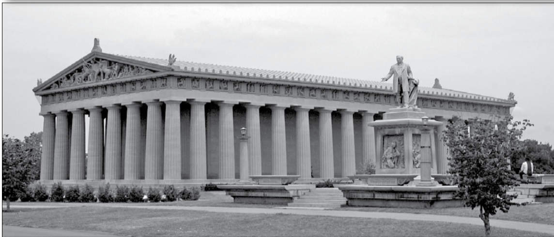
• Парфенон у Нешвілі (штат Теннесі), побудований у 1897 році, – точна копія Парфенону в Афинах

Наша довідка: Неогрецький стиль або неогрек (анг. Neo-Grec) – варіант класицизму в архітектурі 2-ї половини XVIII – 1-ї половини XIX століття, орієнтований на відтворення спадщини античної Греції. Розвивався в період історизму й еkleктики до кінця XIX століття. Його виникненню наприкінці XVII століття сприяли археологічні розкопки давньогрецьких пам'яток Балканського півострова та півдня Італії. Відрізняється від класицизму (й ампіра зокрема) підкреслено археологічним, детальним підходом до відтворення грецької класики, очищеної від впливу давньоримської архітектури й італійського Відродження.