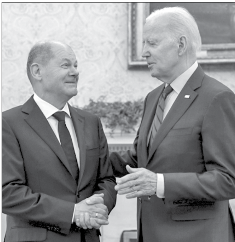
• Джо Байден намагається узгодити свій новий курс щодо українсько-російської війни із західними союзниками, насамперед з канцлером Німеччини Олафом Шольцом

Внаслідок такого збігу позицій Вашингтона й Москви у ставленні до російсько-української війни, точніше до необхідності досягнення домовленостей щодо припинення вогню, вони, схоже, знову, як і 2021 року, готові будуть спільними зусиллями захищати мир у Європі загалом та в Україні зокрема. Цю справу, тоді це завершилося погодженням Вашингтоном деяких загальних модальностей російського вторгнення в Україну та певних його правил. Але цього разу їхні спільні зусилля вже не будуть різновекторними, бо ґрунтуватимуться на єдиній концептуальній основі, яким є «план Байдена». Консенсус двох столиць, що оце формується з питання припинення вогню, має, таким чином, всі шанси перетворити «план Байдена» на такий собі «план Байдена-Путіна з умиротворення України». А може навіть і на однойменний «пакт». Принаймні, нині для України, а пізніше – і для історії, на щось на кшталт «мюнхенської змови».