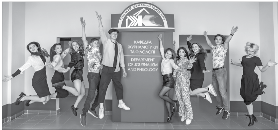
● Попри все, життя триває!

«Медіасвіт веде у всесвіт» – фестиваль шкільних медіа та юних авторів з такою назвою стартував на Сумщині (північно-східний регіон України; близько 560 кілометрів – довжина кордону з Російською Федерацією). Ініціатор заходу – кафедра журналістики та філології Сумського державного університету – реалізує проект у партнерстві з громадськими організаціями: Сумським прес-клубом і обласною організацією Національної спілки журналістів України.