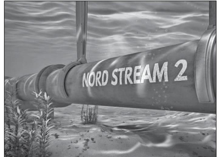
● «Північні потоки» могли підірвати й путінські спецназівці, аби російській стороні не платити гігантські штрафи за невчасні поставки газу

Європейські слідчі заявили 8 січня, що польські посадовці чинили опір міжнародному розслідуванню вибухів на газопроводах «Північний потік-1» і «Північний потік-2» і не розкрили потенційно важливі докази, але сподіваються, що новий уряд Польщі допоможе розслідуванню. Про це пише видання The Wall Street Journal з посиланням на європейських слідчих, які працюють над цією справою.