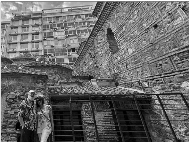
● Фото на згадку на тлі грецького минулого та сучасного

...У старих Атонах, на південно-східному окрайці Плаки (найдавнішої частини міста) стоїть пам'ятник Лісікрату. Більше відомий сьогодні як «Ліхтар Діогена», встановлений ще 334 року до нашої ери. Ротонда з коринфськими колонами, поєднаними заокругленими мармуровими плитами, а над ними – фриз з христоматійним фрагментом життя Діоніса: перетворенням піратів, які викрали бога, на дельфінів. Монумент шести-метрової висоти вінчає кам'яна квітка аканта, на якій колись стояла бронзова триніа – власне, нагорода за перемогу в театральному змаганні. Лісікрат був хореґом. (Як тут знову не згадати добрим словом університетських професорів – викладачів античної літератури!). Попервах хореґом у стародавній Греції називали «керівника хору», котрий виконував також обов'язки, які пізніше розподілилися між корифеєм і дидаскалом (корифей – це актор у хорі давньогрецького театру, який промовляв від імені хору, коли тому доводилося брати участь у дії п'єси, дидаскал – учитель, наставник). З часом статус хореґа змінився: це мав бути заможний громадянин, котрий брав на себе як громадську повинність витрати на утримання хору та підготовку п'єси до постановки в театрі. Сучасними словами, меценат-добродій.