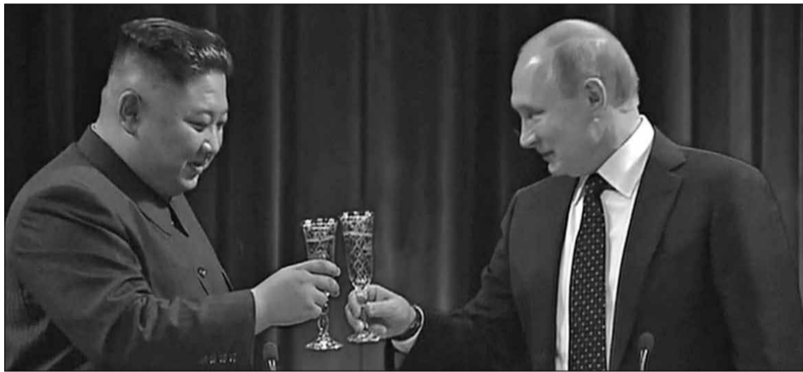
● Одержимий Путін для продовження війни з Україною не соромиться домовлятися про нові й нові поставки зброї з такими одіозними діячами як північнокорейський диктатор Кім Чен Ин

4. Можливо, зміна підходу Путіна до війни проти України пов'язана зі зростаючим тиском громадян на владу внаслідок швидкого поширення серед них антивоєнних настроїв?