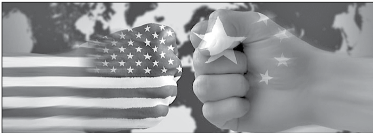
● Китай конфронтує зі Сполученими Штатами, які вперто не бажають підірвати політиці Сі Цзіньпіна стосовно поглинання комуністичним Китаєм Тайваню

Китай оголосив про санкції проти п'яти великих американських оборонних компаній через постачання їхньої продукції до Тайваню. Про це повідомило МЗС КНР у понеділок, 8 січня.