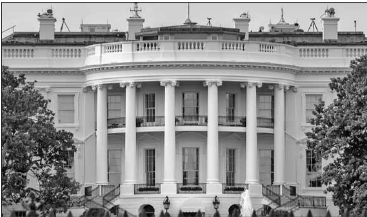
● Вашингтон. Білий дім – уособлення паладіанства