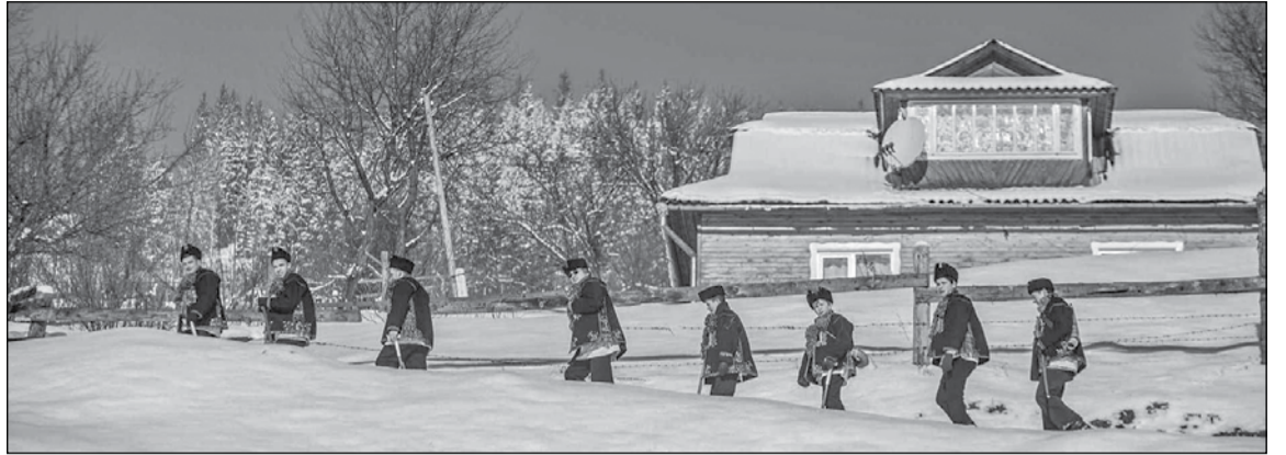
• Гуцульщина. «Розколяда» в Криворівні

У давнину на Поліссі під час розколяди сходились усі колядники для спільного святкування, спалювали різдвяний