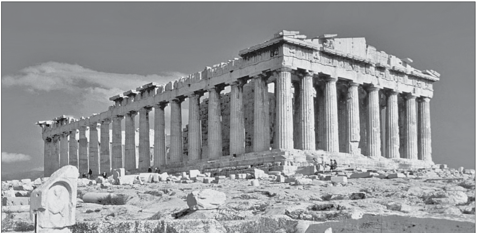
• Атенський Акрополь, який став архітектурним прототипом багатьох сучасних споруд

Зі свого американсько-го чверть століття два десятиліття ми прожили в нью-йоркському Ріго-парку. Відомому сьогодні як «Маленький Самарканд». На початку 2000-х років на наших очах приватні добротні, але однотипно старомодні дво-триповерхові вілли перетворювались на палаци. Щоб перевтілити цегляний правильно-прямокутний триповерховий будинок забудови 1950-х років у вельможний маєток, но-